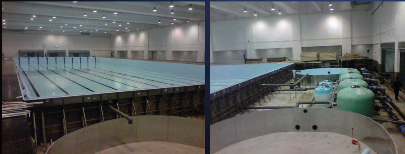
上海东方体育中心